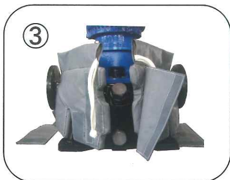
マジックテープ(中央/側面)を留めて、上部の紐を縛ります。