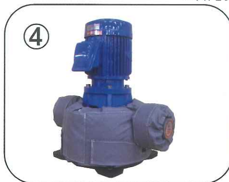
取付後の状態(完成) (フランジ部はオプションです。)