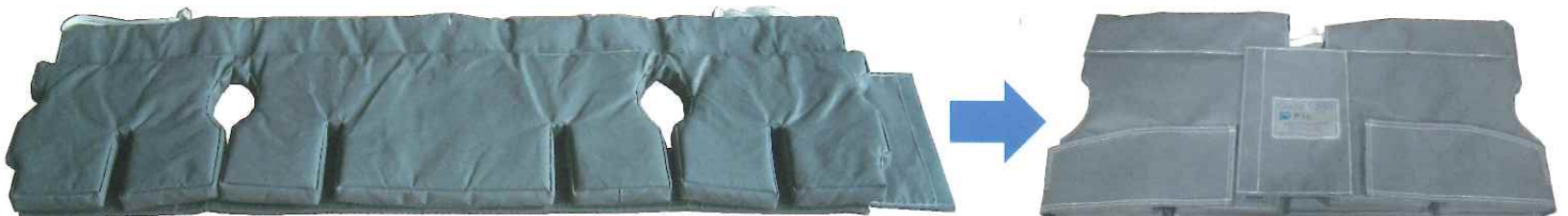
ケーシングカバー展開時