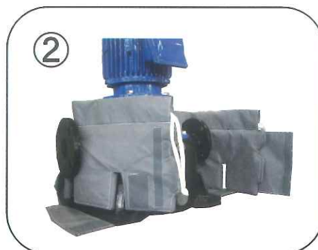
フランジ部(吸込/吐出)に本体を引掛けます。